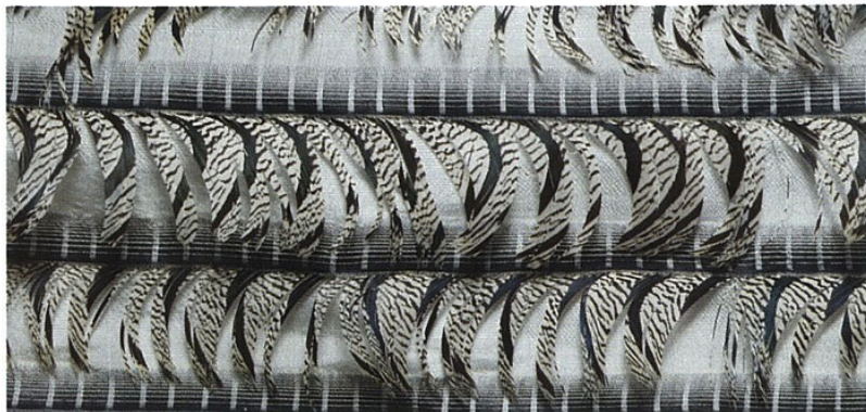
En haut à gauche : Fil de l'Ange , 2012, manteau taillé dans une guipure de plumes brodées avec Michèle Lemaire, exposition Futurotextiles.